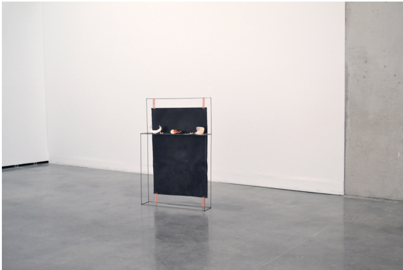
Un bosque, un jardín (A.P./L.I.) , 2023. Hierro, cerámica, yeso, plastilina, cobre, grafito sobre papel, flores secas, 120x80x15 cm. Producción: Centro Huarte de Arte Contemporáneo.

Mi manera de acercarme a la práctica artística ha ido cambiando con el tiempo. Por ejemplo, desde I wish you'd rub your quills against me (2020) hasta s/t (atravesar el jardín) (2023), apenas han pasado cuatro años; pero son unos años en los que he tenido la oportunidad de pasar por diferentes situaciones académicas, artísticas y personales que han influido en mis modos de hacer. Si antes había una tendencia a controlar los resultados subordinándolos a una forma, actualmente me permito más libertad en el proceso. Hay mucho más disfrute en ello.