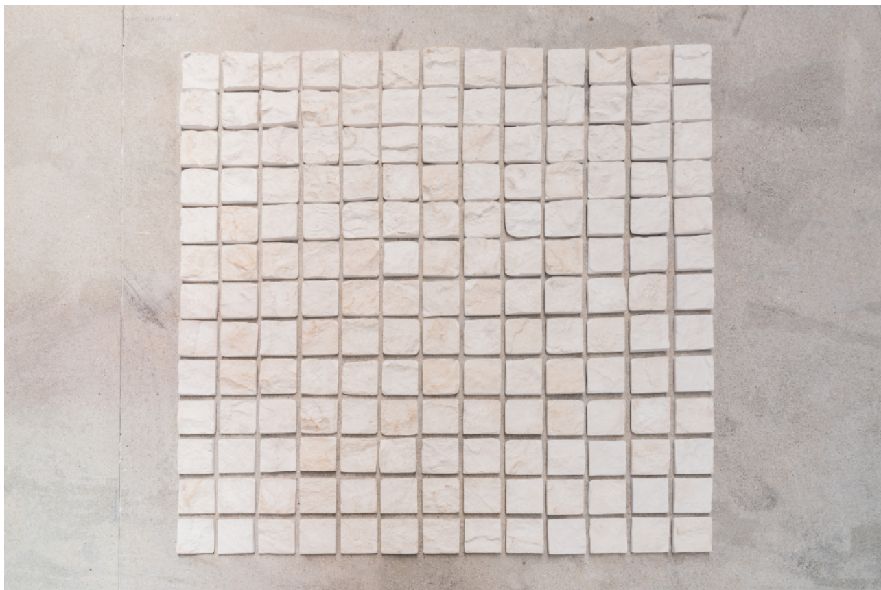
S/T (169 afectos, 169 huellas o 169 impresiones de una roca ahora que escalo rocas con mi cuerpo) , 2022. Escayola y pigmentos, 142x142x1.5 cm aprox. Producción Fundación María José Jove.

La residencia fue fundamental a la hora de empezar a incluir situaciones espaciales en mi práctica, especialmente aquellas relacionadas con el bosque o jardín, así como a estar más atenta al desplazamiento y la movilidad.